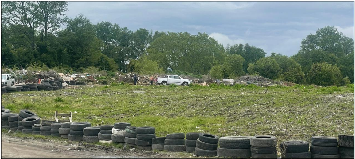
Foto 2. Vertedero Municipalidad de Panguipulli estación de transferencia, sector de acopio de residuos biodegradables (parque y jardines).