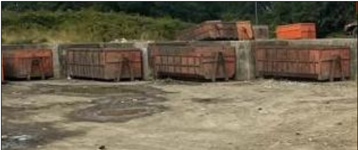
Foto 3. Vertedero Municipalidad de Panguipulli estación de transferencia, sector de acopio de residuos municipales.