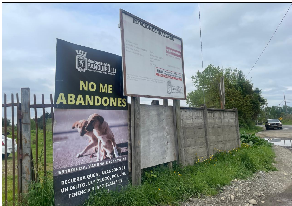
Foto 1. Vertedero Municipalidad de Panguipulli estación de transferencia.

La totalidad de residuos generados fueron gestionados con destino final hacia las instalaciones del vertedero Municipal de Panguipulli ( Foto 1 ).