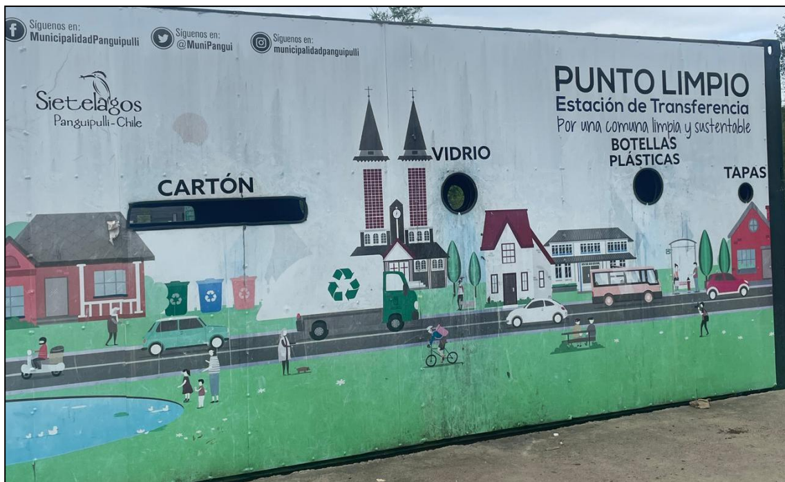
Foto 4. Vertedero Municipalidad de Panguipulli estación de transferencia, sector de acopio de residuos de papel, cartón y envases plásticos.

En cuanto a los residuos correspondientes a maderas libres de impregnación o pintura, generados entre octubre a diciembre de 2025, estos fueron reutilizados dentro de la obra por topografía para la confección de estacas para balizado o estaquillas de nivel y para calefacción ( Foto 5 ).