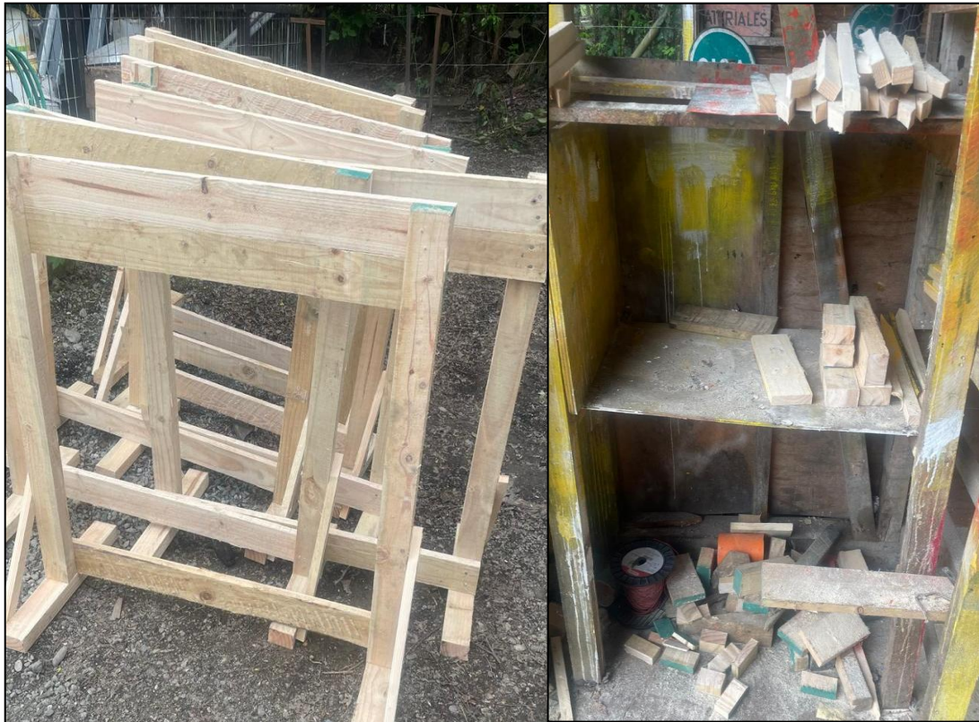
Foto 5. Estacas y estaquillas topografía, además de material para calefacción.